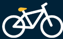
Beicio i'r gwaith