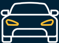
Parcio am ddim ar y safe

Cynllun Hyblyg - Cyfle i ystwytho eich oriau gwaith er mwyn helpu ymdopi â bywyd y tu allan i'r gwaith.