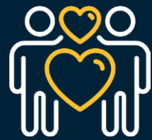
Iechyd a Lles