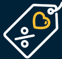
Cynllun disgownt i staff